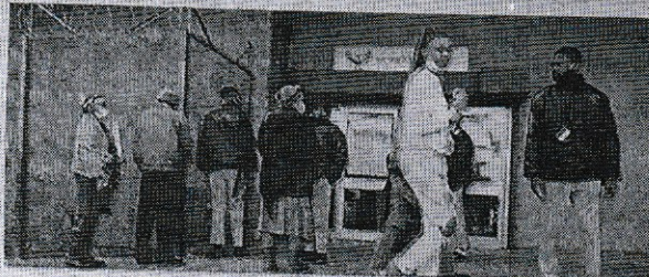
Lang tye mense buite die kantoor van die meester in Pretoria is 'n alledaagse gesig, met net 'n breekdeel van die toonbanke wat beman word.

hul waar daar nie genoeg beddens vir almal is nie. Die ma raap en kraap met 'n