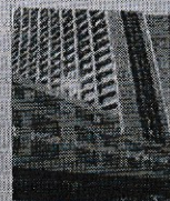
Die Salu-gabou in Pretoria, waar die hoofstad se meesterskantoor is.

■ Hulle kan nie hul daaglikse uitgawes sonder dié geld dek nie ■ 'Dis soos 'n swart gat in die ruimte: alles gaan in, niks kom uit'